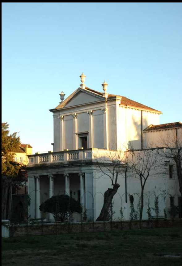
Biblioteca Zenobiana del Temanza Sede del Centro Studi e Documentazione della Cultura Armena

Dabagyan, nato nel 1965 in Armenia, insegna al Conservatorio Statale di Erevan. Dal 1991 ha intrapreso una carriera che lo ha portato a farsi apprezzare a livello internazionale e a collaborare con musicisti come Gidon Kremer, Jan Garbarek e Yo-Yo Ma che lo ha coinvolto nel suo progetto Silk Road (la Via della Seta). Su iniziativa del Centro Studi e Documentazione della Cultura Armena, il Trio Dabagyan è stato più volte in Italia, ospite ai festival di Musicarmena, al Ravenna Festival, all'Aterforum Festival di Ferrara, alla V Rassegna di Musica Contemporanea Est Ovest 2006 di Torino, al festival promosso dall'Associazione Suoni e Pause di Cagliari e alla Fondazione Giorgio Cini di Venezia.